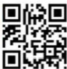
AULAS VIRTUALES CRA MORÁN BAJA